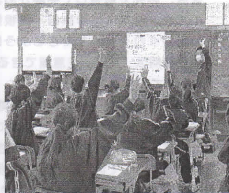
4/22 修学旅行説明会の様子